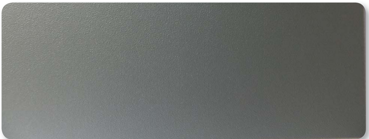
steingrau stone grey