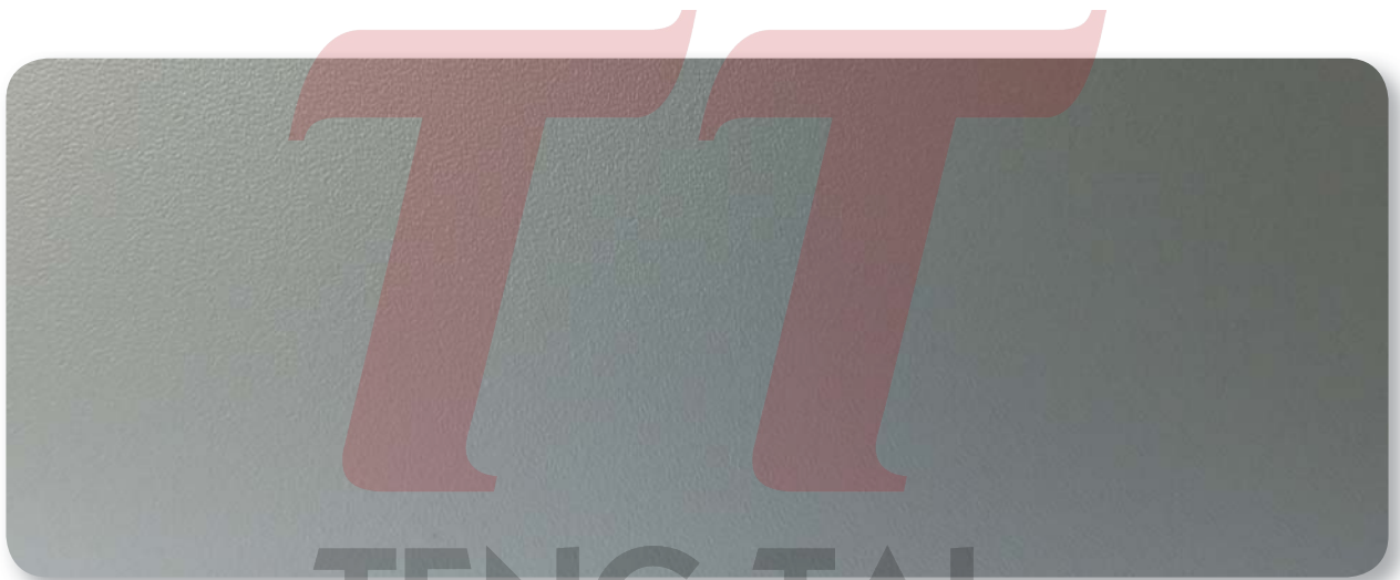
silbergrau silver grey